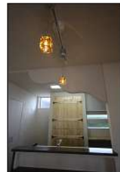
お施主様が塗った下がり壁♪

キッチン前の下がり壁は、お施主様自身で塗った力作です!! お施主様と大工さんとで、サイズなど細かな部分を話し合いながらできた棚など、お施主様が参加した家づくりは愛着のあるやさしい家になりました。